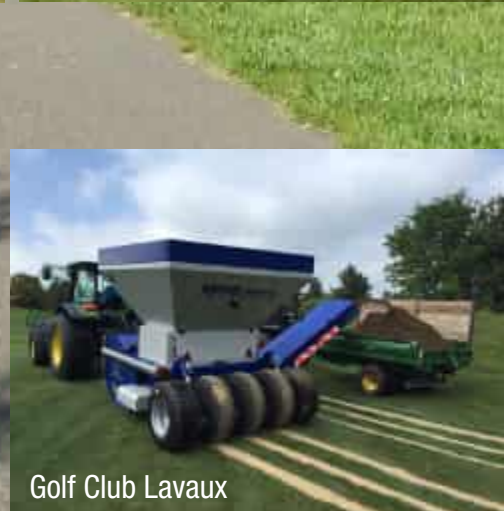
Golf Club Lavaux