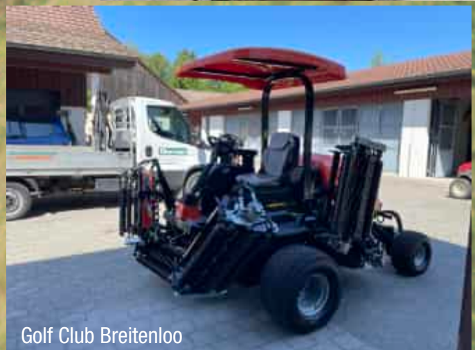
Golf Club Breitenloo