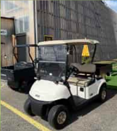
Switzerland Innovation Park Zürich