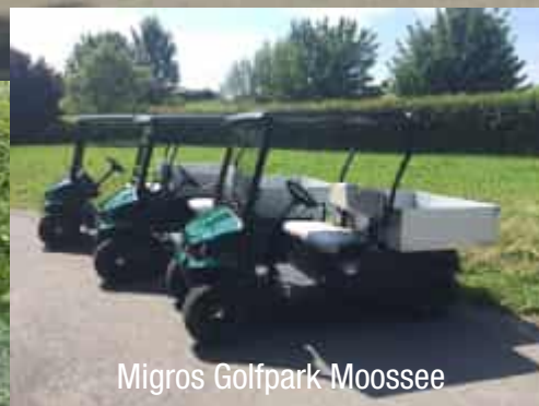
Migros Golfpark Moossee