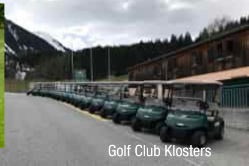
Golf Club Klosters