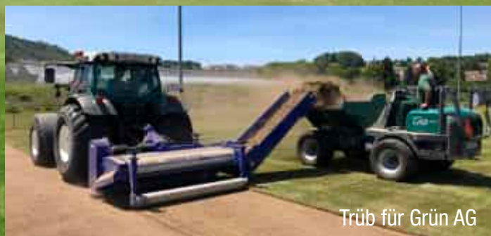
Trüb für Grün AG