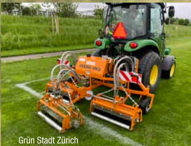
Grün Stadt Zürich