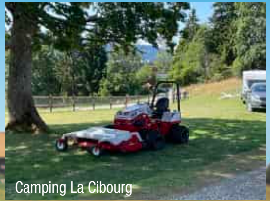
Camping La Cibourg