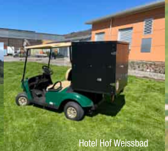
Hotel Hof Weissbad