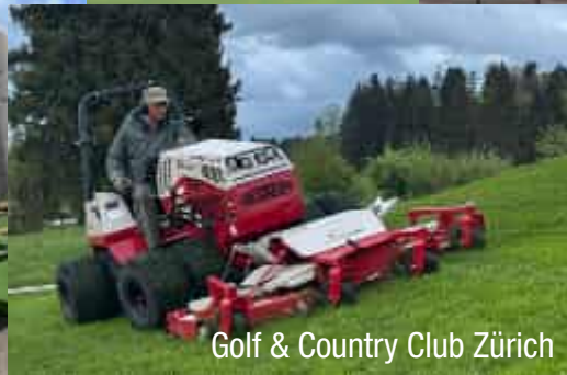
Golf & Country Club Zürich