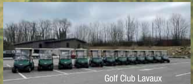
Golf Club Lavaux