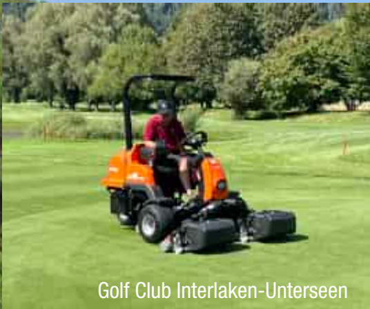
Golf Club Interlaken-Unterseen